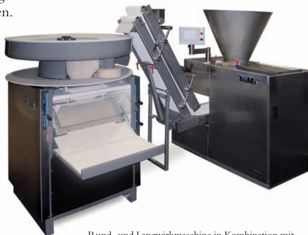
Rund- und Langwirkemaschine in Kombination mit Teigabwieger TA, inklusive Hochförderband